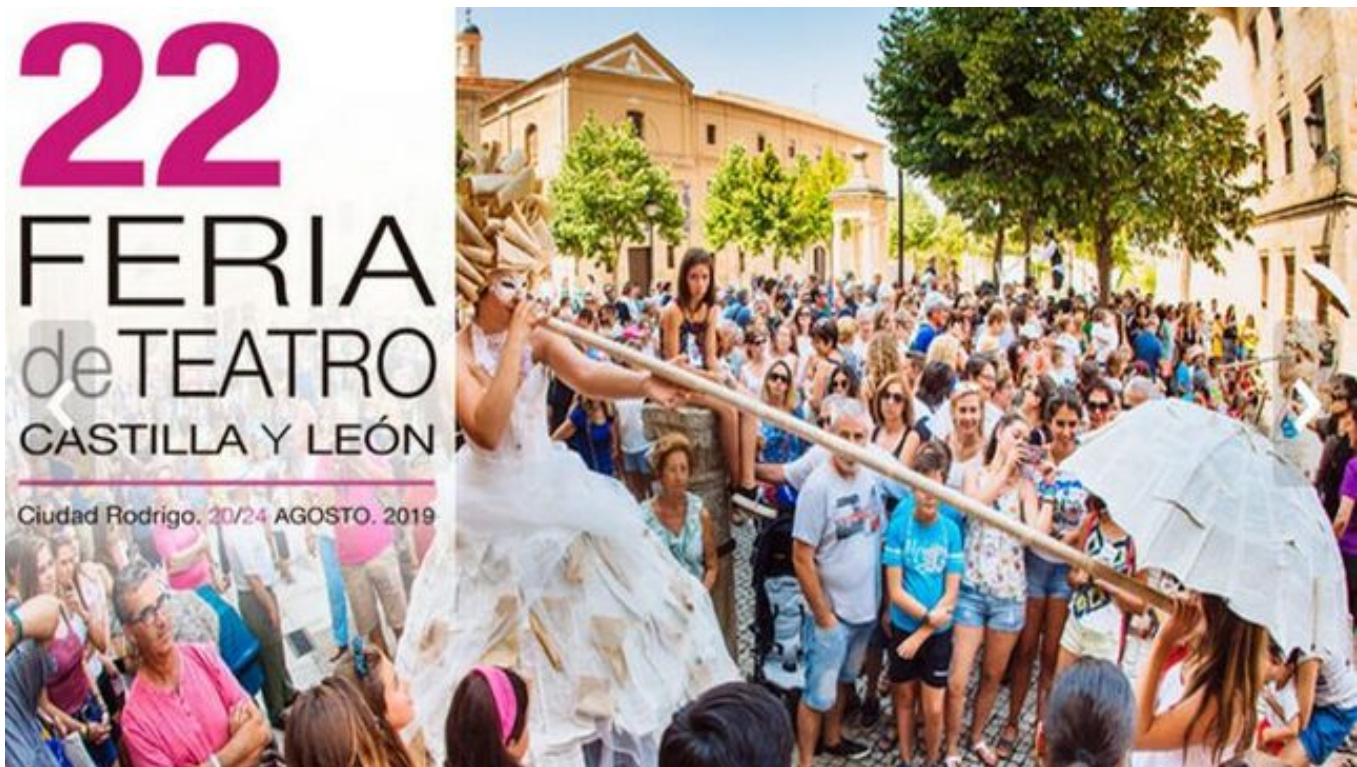
Cartel de la Feria de Teatro de Castilla y León 2019.

Las compañías Arawake, Pie Izquierdo, Radar 360° y La Pera Llimonera, entre otras, ofrecerán un total de diez propuestas escénicas que serán las encargadas de bajar el telón este sábado a la vigésimo segunda edición de la Feria de Teatro de Castilla y León que se celebra desde el pasado 20 de agosto en Ciudad Rodrigo (Salamanca).