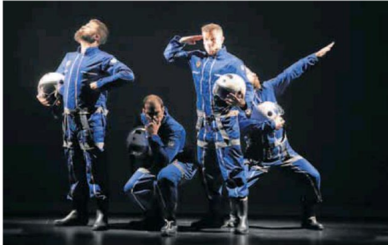
'Viaje al centro del cuerpo humano' de Spasmo recala hoy en la Feria.