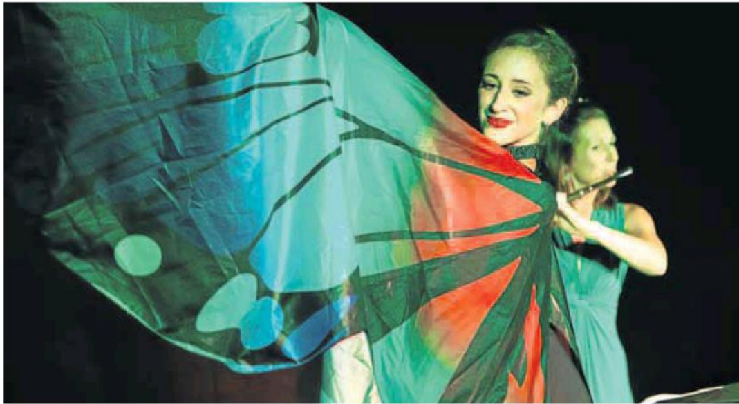
'Donde nace la música' de Yamparampán se estrenó en el Espacio en Rosa.