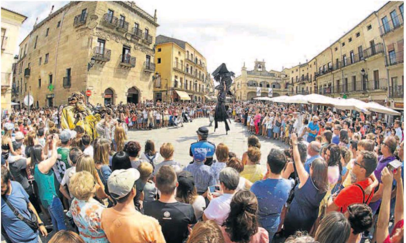
Los espectáculos de calle, como ayer este de Samarkanda Teatro titulado 'Los sueños de Hércules', son secundado de forma masiva por el público.