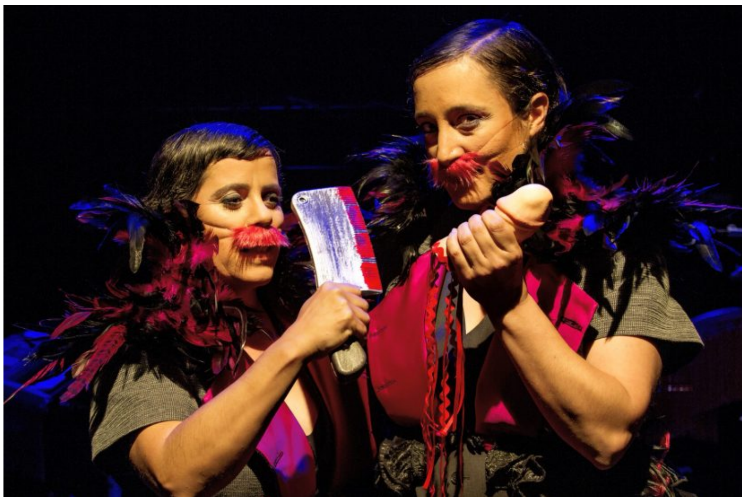
Degenérate mucho de las XL.

Como comunidades con más presencia en la Feria, tras Castilla y León, figuran Andalucía, con cuatro compañías (Locomotiva, con Bric a Brac ; Las Niñas de Cádiz, con El viento es salvaje ; Zen del Sur, con Órbita , y Las XL, con Degenérate mucho ), y Valencia, que iguala a Extremadura con tres (Colectiu Frenetic, con Save the temazo ; Arden producciones, con La invasión de los bárbaros , y Leamok, con Lázaro ). La madrileña Ensamble Bufo ( Amor médico ), la navarra La Banda Teatro-Circo ( Kimera ), la cántabra Ruido Interno ( De Paseo ), la asturiana Zig Zag Danza ( Cita en el marco ) y la vasca Sarini Zirco ( ¡Qué pájara! ) forman parte también del programa de la 23 edición.