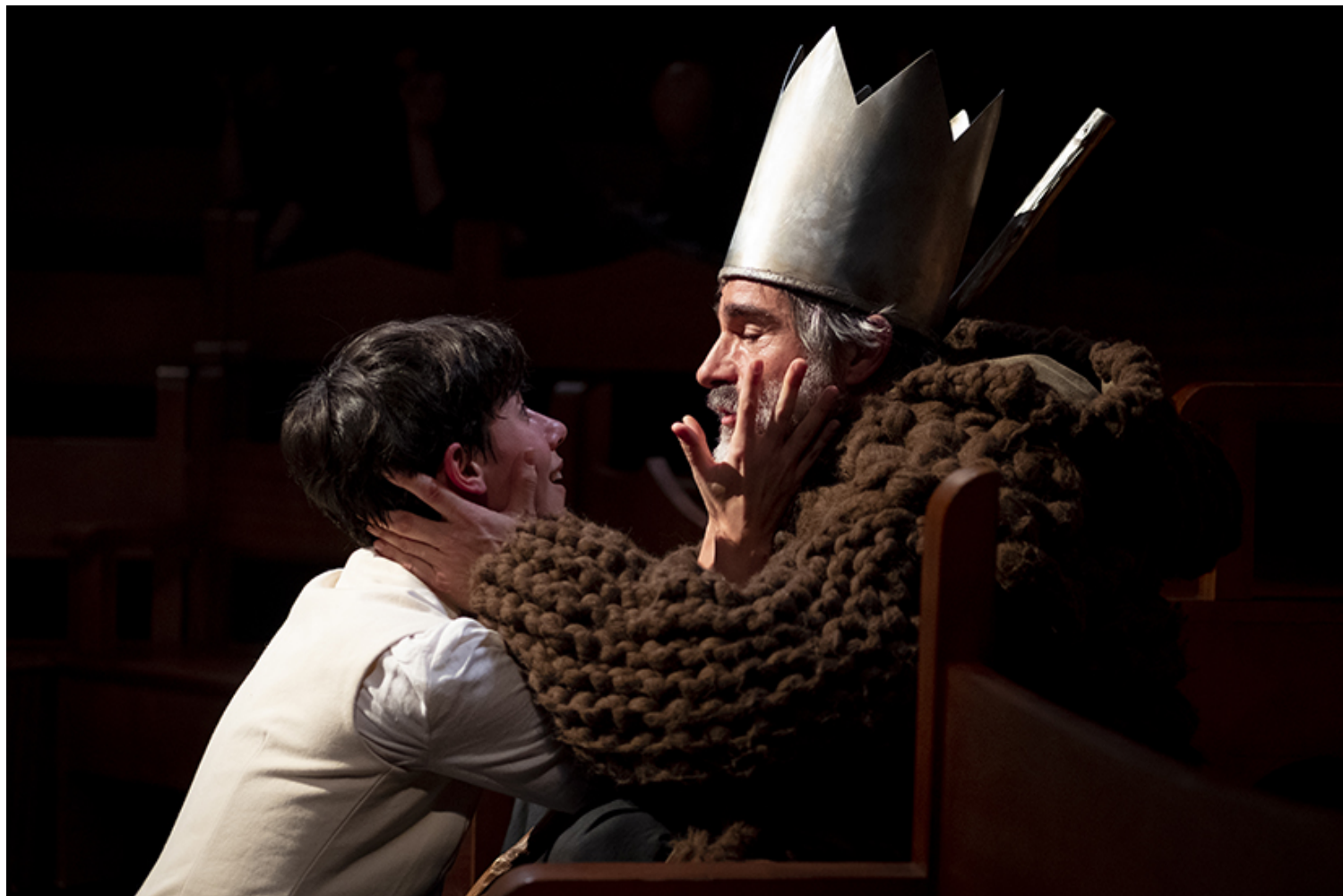
Nise, la tragedia de Inés de Castro de Nao d'Amores.

Jerónimo Bermúdez, la singular peripecia vital de la amante de don Pedro de Portugal. A esa puesta en escena se sumarán hasta el día 29 más de medio centenar de representaciones de distintos formatos, para todos los públicos y de géneros variados: teatro de actores, de títeres, gestual, montajes multidisciplinares, danza, circo y artes de calle. Prácticamente la mitad de la programación se presentará en primicia, 12 como estrenos absolutos y 2 más que se estrenarán en su versión en castellano.