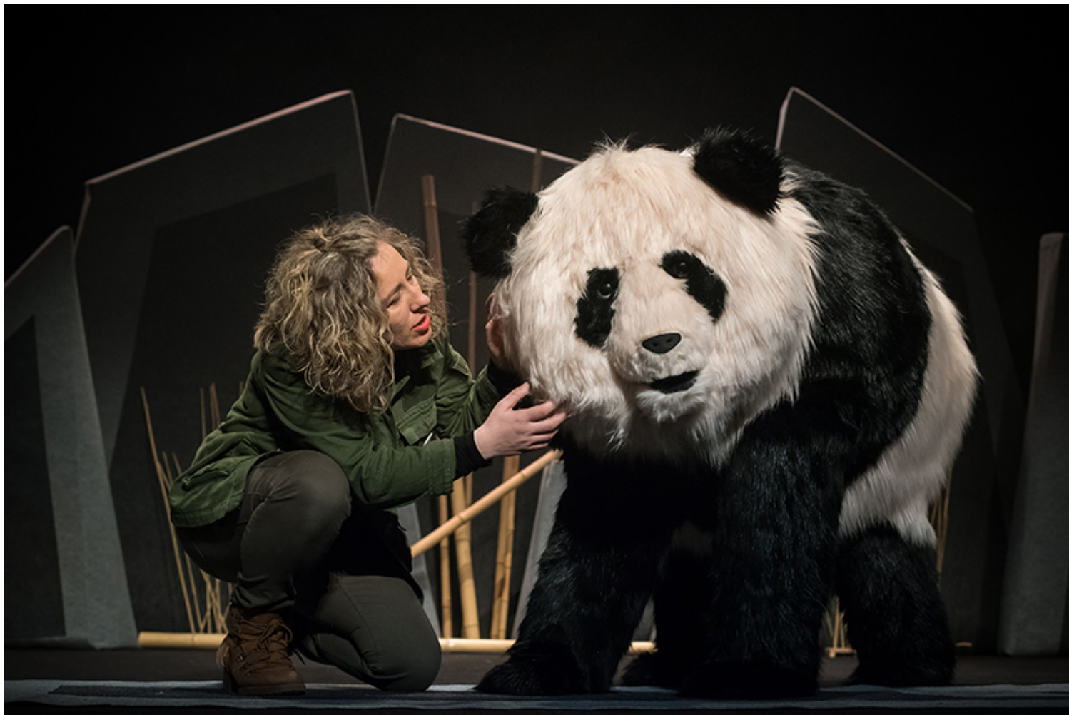
Mai Mai de Baobab