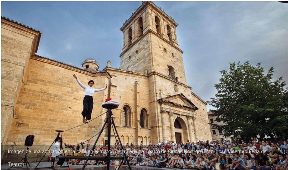
Imagen de una actuación en la calle en el marco de la Feria de Teatro de Ciudad Rodrigo