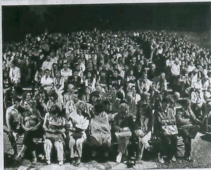
Distintos escenarios. Si en la noche del martes, primera jornada de la Feria de Teatro, el patio de Los Sitios fue uno de los referentes escénicos, con un lleno absoluto para ver a La Serda y su Por un cuñado de dólares , el Teatro Nuevo Fernando Arrabal es el escenario señero, en el que ayer se ofreció el primer estreno absoluto de la Feria con Los animales de don Baltasar , de Teloncillo, un espectáculo para los más pequeños.