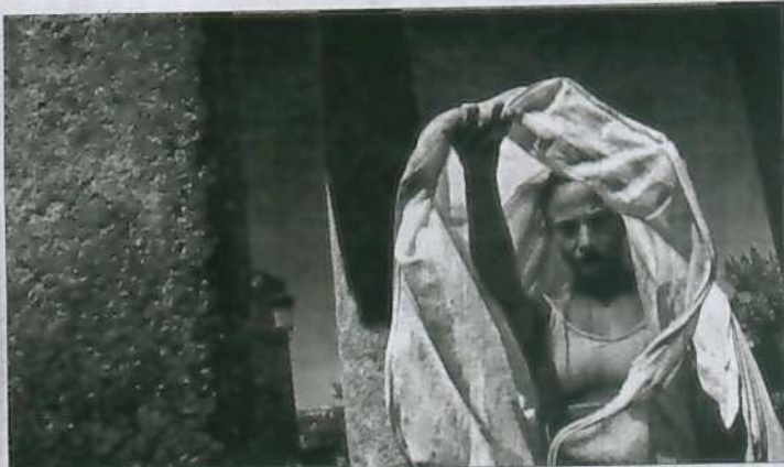
Acrobacia y danza en la plaza de Pérez de Herrasti. La plaza de Pérez de Herrasti volvió ayer a ser referencia de un espectáculo abierto. En esta ocasión con la participación de la compañía Jordi L. Vidal, que puso en escena el espectáculo Chrysalis , un montaje en el que se combinan la acrobacia y la danza.