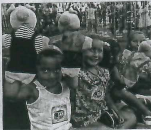
Niños y niñas se implican en los distintos talleres planteados.

Divierteatro , el programa de animación infantil vinculado a la Feria de Teatro de Ciudad Rodrigo, tuvo ayer su estreno. Quedan todavía otras tres jornadas. Pero se aprecia que esta iniciativa de Cívitas se mantiene en ebullición, tal vez por la frescura que en cada edición se le quiere dar. Porque, como