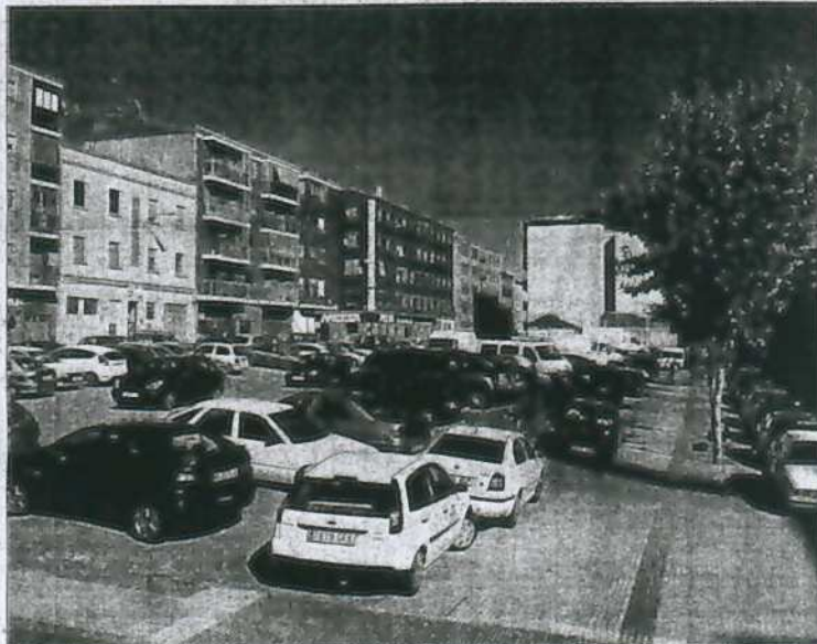
APARCAMIENTO. Numerosos vehículos estacionados en el solar que el Ayuntamiento pretende urbanizar.