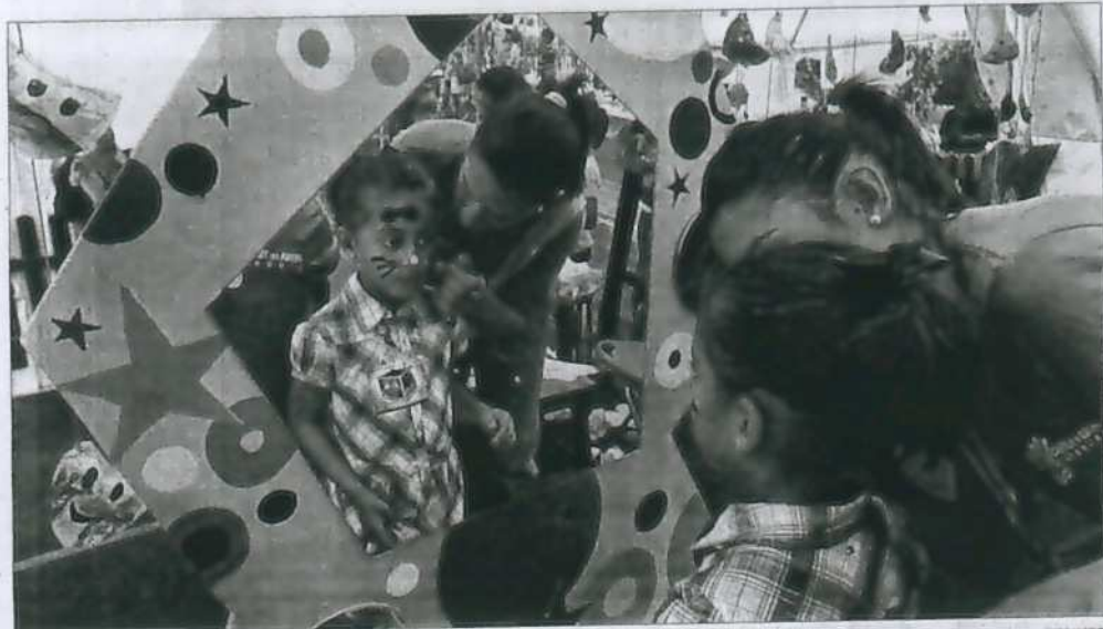
Los más pequeños del Divierteatro se acercan por vez primera al mundo del maquillaje para entablar contacto con el mundo escénico.