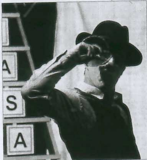
La Sala B de las Teresianas de estreno. La organización de la Feria de Teatro de Castilla y León siempre ha buscado la incorporación de nuevos espacios escénicos para potenciar todo el entramado urbano como un potencial escenario. En esta edición, uno de los espacios novedosos como escenarios ha sido la denominada Sala B de las Teresianas. Allí se ofreció el espectáculo El viento , de la compañía lusa Visões Úteis, un montaje en el que el público pasa a ser miembro del equipo artístico, desarrolla un trabajo colectivo y se transforma en intérprete y dramaturgo del espectáculo.