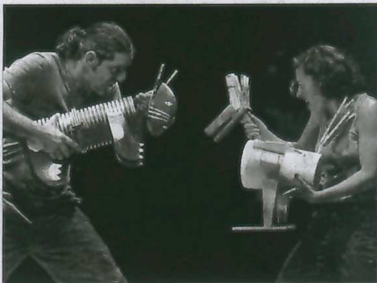
Los actores de Teloncillo, compañía que presentó en la Feria el montaje Los animales de don Baltasar , un estreno absoluto.

La programación matinal contó también con la participación de otras dos compañías. Los portugueses de Visões Únicas presentó un espectáculo familiar, pero dirigido a niños a partir de los cuatro años. El viento es el título que presentaron, un teatro físico y visualmente poético, sin palabras. Además, en