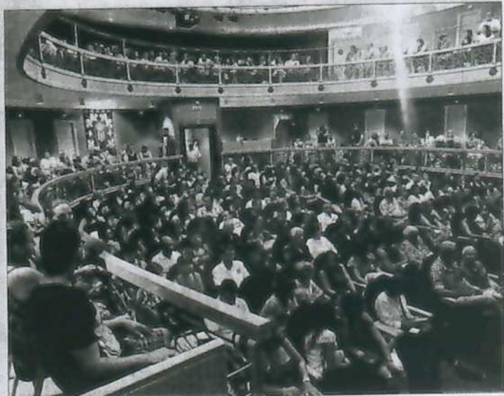
Llenos en la calle y en las salas. En la noche del miércoles se presenciaron el primero de los pasacalles previstos, con fuego y pirotecnia, a cargo de la compañía Teatrabo y su espectáculo Drakomakia y que fue seguido por cientos de personas en su desarrollo. Pero es que también los espectáculos de pago, en las salas, ponen el cartel de no hay billetes.