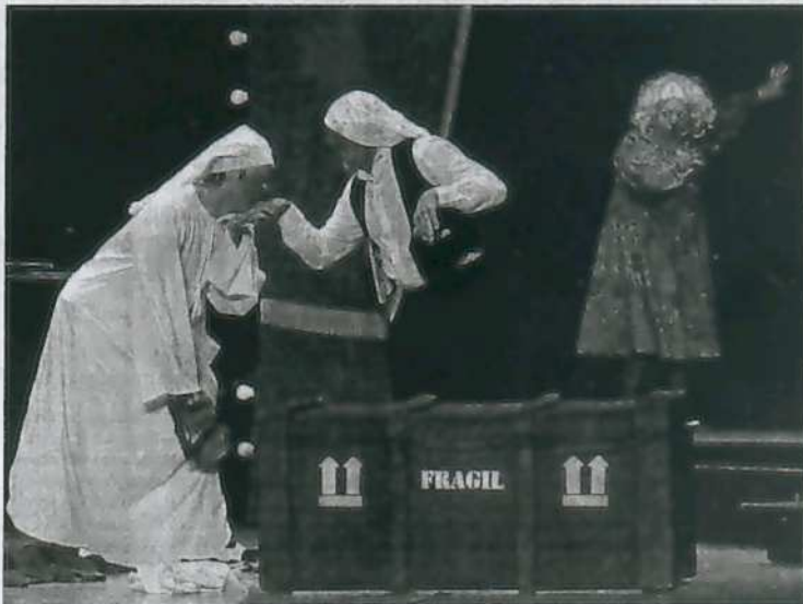
La compañía burgalesa Teatro La Sonrisa representó Smile en el Teatro Nuevo Fernando Arrabal.

Teatro La Sonrisa, Bambalúa Teatro, Spasmo Teatro y Teatro del Azar fueron las compañías que