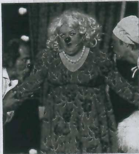
Teatro La Sonrisa. La franja horaria de la mañana se centra en su mayor parte con los espectáculos infantiles y familiares. La jornada de ayer se inició con el montaje Smile , de la compañía burgalesa Teatro La Sonrisa, en la que el público se divirtió con la trama: Un empresario del espectáculo al borde de la ruina quiere levantar su empresa contratando a una gran diva extranjera y excéntrica. Con la ayuda de su pianista, con el que lleva toda la vida trabajando, intentan sacar adelante el espectáculo originando un sinnúmero de situaciones hilarantes en los ensayos previos.