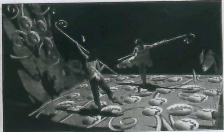
Danza interactiva en el salón de Los Sitios. TPO puso ayer en escena Farfalle (Mariposas), un espectáculo de danza interactiva y artes visuales, no convencional, dedicado a los niños y niñas pintores y bailarines a través de la historia del nacimiento y vida de las mariposas, vistas como bailarinas y pintoras que danzan y pintan en el aire con sus alas, con su vuelo.