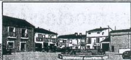
Población leonesa de menos de veinte mil habitantes aislada, insolvente, desamparada y mohina después de un eventual desmantelamiento de su Diputación.