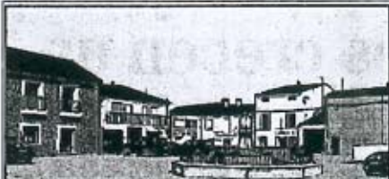
Población leonesa de menos de veinte mil habitantes perfectamente proveída, confortada y administrada por su Diputación.