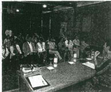
Apertura de la Jornada de Formación "Fernando Urdiales" en Los Águila.