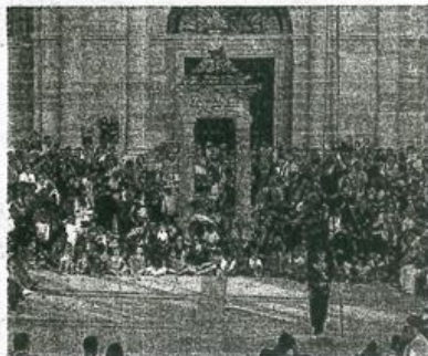
El público se trasladó del Teatro Nuevo a la Plaza de Herrasti.